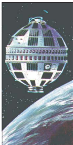
Az első távközlési műhold, a Telstar, 1962

Új Föld-szemlélet körvonalai látszanak. Az űrkutatás az elméleti tudományból – a matematikából és csillagászatból – műszaki tudománnyá, azaz tapasztalati tudománnyá is nőtt. Az ember űrutazásait követően (1961–1969) a szomszédos égitestekről anyagmintákat hoznak. Műholdakat felbocsátva (1970-es évek), a fotózást tökéletesítve négyzetméternyi pontossággal fényképezik le a Föld növény-, talaj- és tengervilágát, azok mozgását. A műholdrendszer tartozéka már a globális fegyverrendszereknek, és természetesen a világ bármely pontján fogható kép- és szóbeli információközvetítéseknek. S a számítógépen már kis unokáink bámulattal nézik a Földről készült műholdas űrfotós-programot.