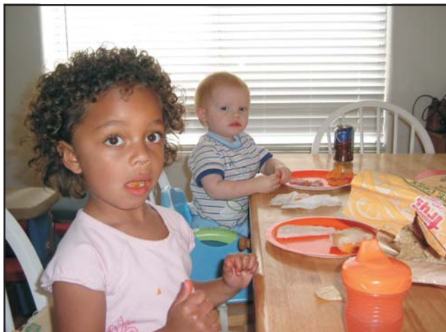
Kevért rasszjegyeket mutató gyerekek