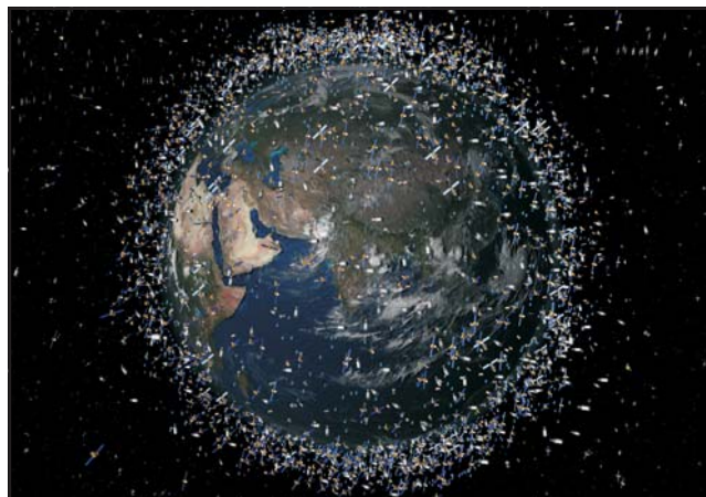
Műholdak a Föld körül, 2010

A cikk részlet a szerző nagyobb munkájából („Korunk kulturális körképéről”), amely a következő témákat tárgyalja az 1970–2005 közötti évtizedek történelméből: 1. A magyar kultúra a globális kulturális térben, 2. A közműveltség a figyelem központjában, 3. Az euroatlanti térségen kívüli népek megjelenése a kultúrában, 4. Informatikai forradalom, információs (tudásalapú) társadalom, 5. A képi, zenei, mozdulatnyelvre épülő kifejezési formák erősödéséről, 6. A világnézeti forrongás kora, 7. Az unió közös kultúrpolitikáját várva, 8. A kis nemzeti kultúrák sorsa. Biodiverzitás és kulturális diverzitás, 9. A jövő kérdései.