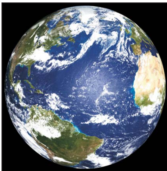
A Gaia-szemlélet képviselői egységes, élő egészként tekintenek Földünkre