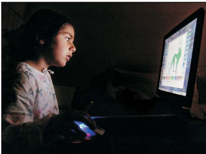
Az internet révén eddig nem is remélt információkhoz juthatunk. Ugyanakkor a gyermekek pszichés fejlődésére (is) kedvezőtlen az egyre több, számítógép előtt töltött óra

Kortársaink (még) mosolyognak, amikor azt mondjuk: az élő Föld, Gaia nem óvható és nem uralható hatékony, világevénységű szabályozás, szankciók és végrehajtásra is felhatalmazott világintézmények nélkül! Mondjuk: a tudomány felelőssége – mind a társadalmat, mind a természetet vizsgáló tudomá-