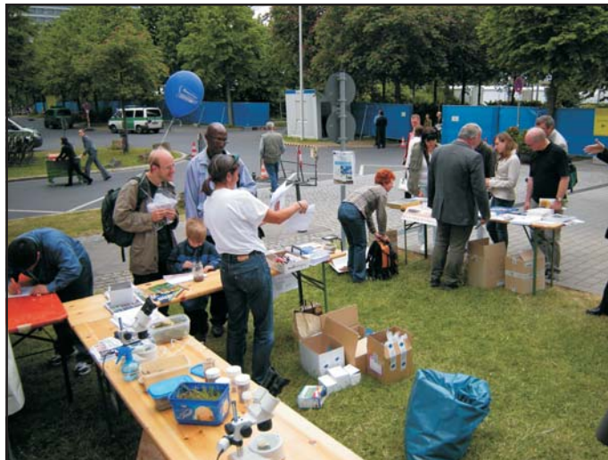
A biológiai sokféleség egyezményét kimondó riói konvenciónak is emléket állít a biodiverzitás világnapja. Az emléknapon aktivisták tájékoztatják az érdeklődőket. Bonn, 2008. május 22.

És e ponton ismét a tudomány felelősségéhez érkezik gondolatmenetünk. Vajon becsüli-e azt a készséget és ismeretegyüttést a tudomány, amelyik a természet- és társadalomismeretek szintetizálására tesz alkalmassá? Hogy a 20. századi természettudományok következtetéseit azok társadalmi kihatásával ütköztesse. Amihez mindkét „ismeretegyüttés” – a természet- és társadalomismeret – uralására is szükség van. Részdiszciplínákra tagolt, impaktfaktor-idézettiséget kergető „tudományos közéletünkben” hol van az ilyen kutatók helye? Vajon nem kellene felülvizsgálni mindenekelőtt a filozófia tudományának 19. századi tematikai utélagzásait? Amikortól a filozófia jobbára csak a társadalomismeretek szintetizálására vállalkozik. És visszatérni a filozófia ezeréves hagyományaihoz: amikor az még a világ egészének megragadását tekintette céljának. A természet- és társadalomismeretek „új szín-