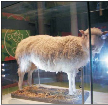
Dolly (1996–2003), a klónozott birka ma már kiállítási tárgy

tézis”-ét. Az ezredforduló törekvése az elvárásunk.